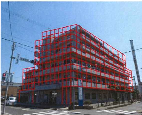
※一期工事足場仮設イメージ